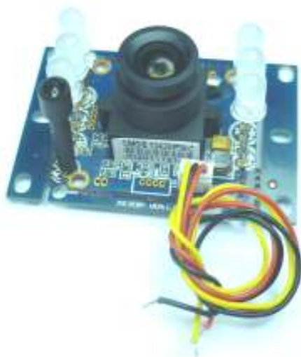
Рис. 1. Общий вид изделия